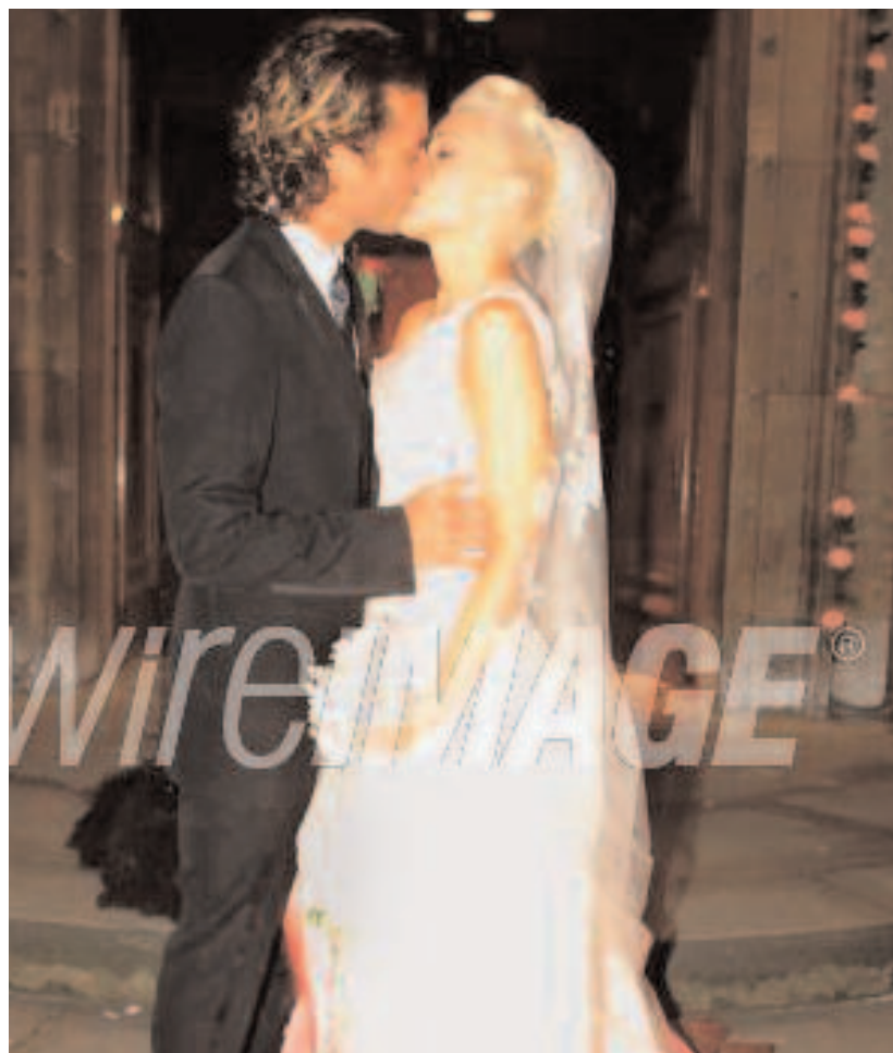
GWEN STEFANI date de naissance : 3 octobre 1969