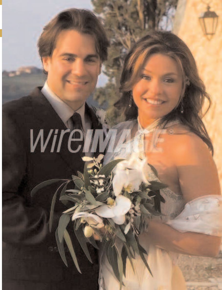
RACHAEL RAY date de naissance : 25 août 1968

Le succès et le bonheur de toute relation dépendront de votre volonté de vous éloigner vers un autre cadre de vie et de faire en sorte d'être moins dépendant de votre famille.