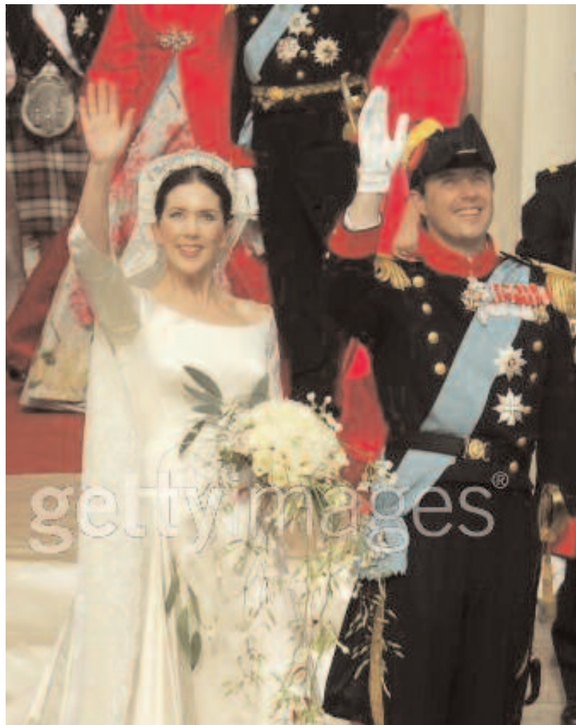
MARY DE DANEMARK date de naissance : 5 février 1972

Si vous vous êtes récemment impliqué dans une nouvelle relation, assurez-vous que la personne que vous aimez est émotionnellement disponible. La loyauté et le dévouement seront les clés d'une heureuse vie amoureuse dans les années à venir.