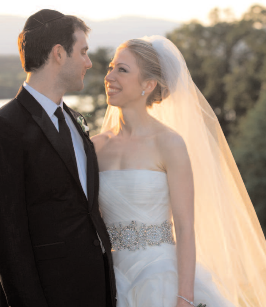
CHELSEA CLINTON date de naissance : 27 février 1980