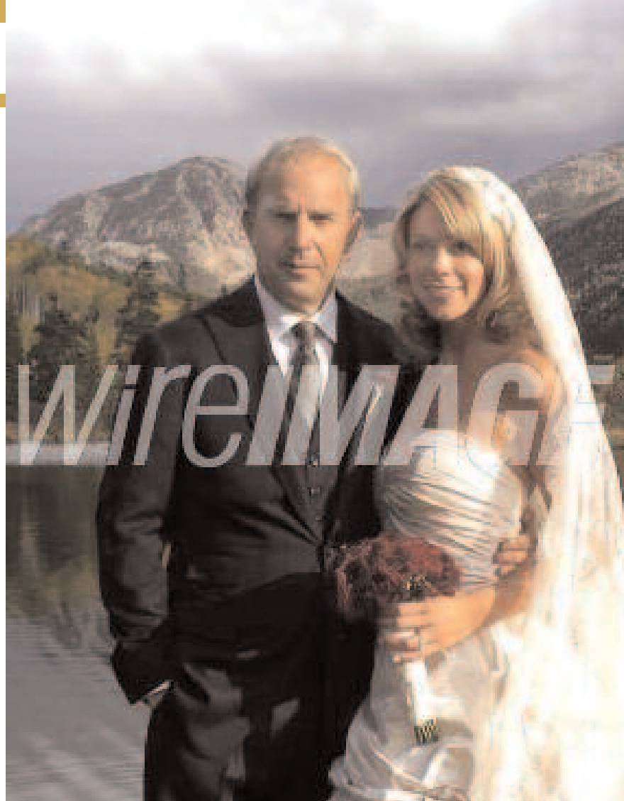
KEVIN COSTNER date de naissance : 18 janvier 1955

Le mariage devra se dérouler avant le mois de mai 2011, pour éviter de soudaines déceptions. Essayer d'éviter de vous engager avec quelqu'un de plus jeune que vous, car cette relation ne durera pas toujours.