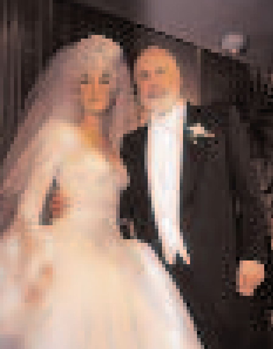
CÉLINE DION date de naissance : 30 mars 1968