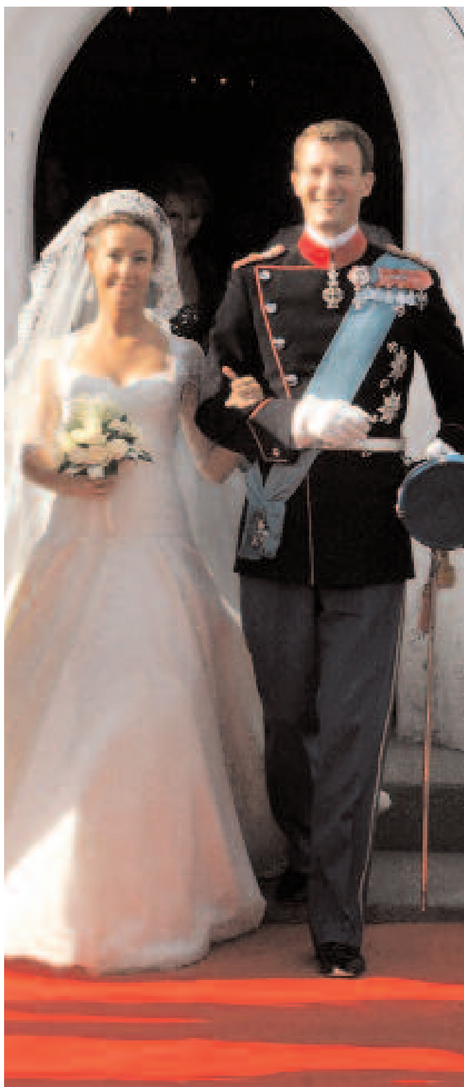
MARIE DE DANEMARK date de naissance : 6 février 1976