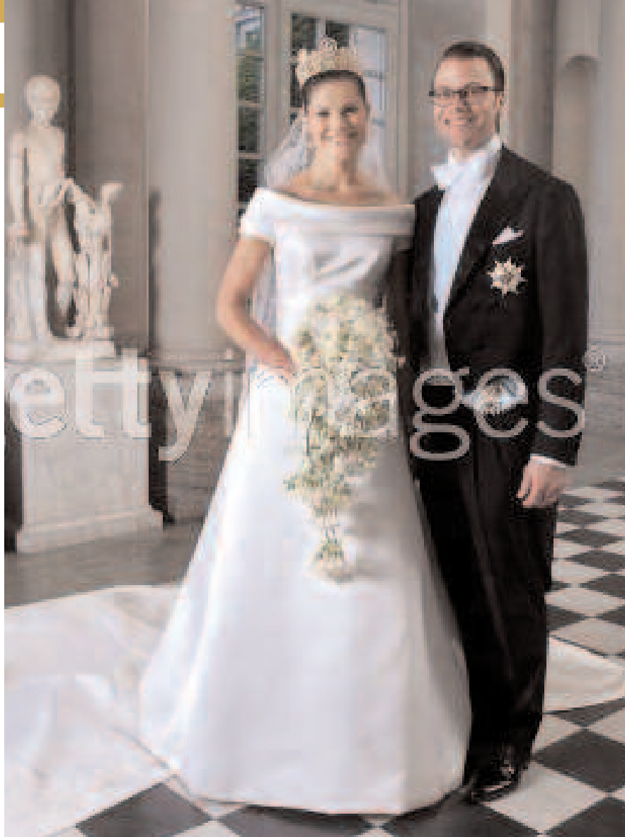
VICTORIA DE SUÈDE date de naissance : 14 juillet 1977

Les amours avec quelqu'un de plus jeune peuvent conduire à des situations frustrantes. Vous devrez vous assurer que la personne que vous aimez est psychologiquement prête pour une nouvelle relation.