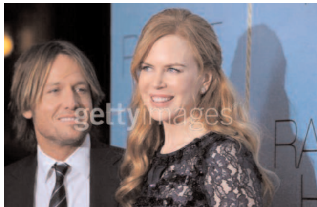
NICOLE KIDMAN date de naissance: 20 juin 1967