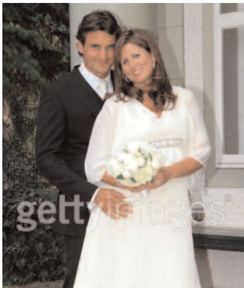
ROGER FEDERER date de naissance : 8 août 1981