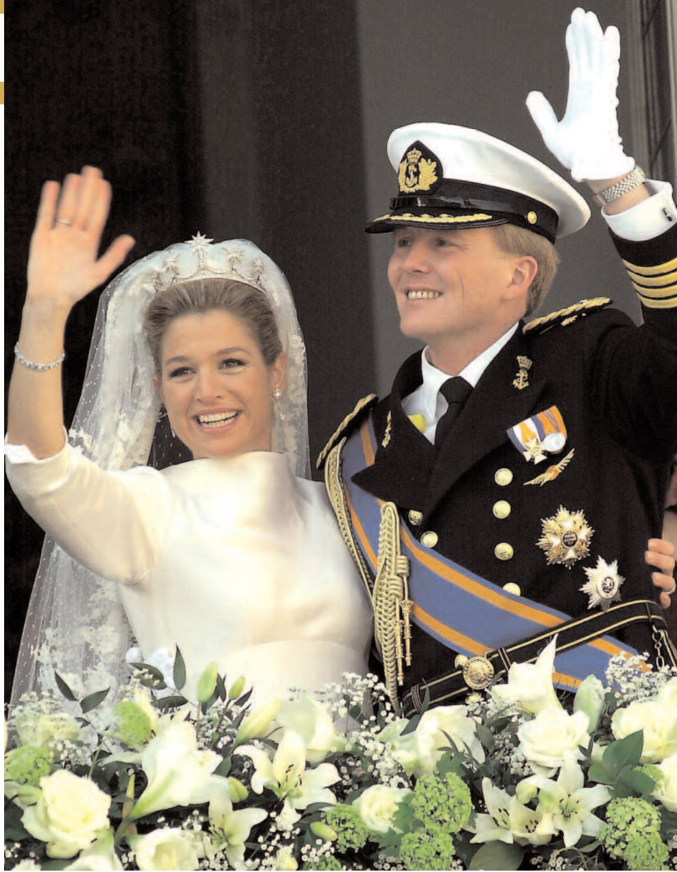
MAXIMA DES PAYS-BAS date de naissance: 17 mai 1971